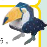
出来上がり イメージ