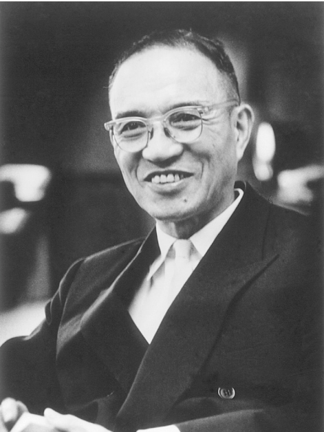
이시바시 쇼지로 (1889~1976)

이시바시 쇼지로 기념관은 이시바시 문화센터 개관 60주년을 맞은 2016년 11월에 공익재단법인 이시바시재단이 이시바시 미술관 별관을 리모델링하여 구루메시에 기증했습니다. 이시바시 쇼지로의 평생 고향인 후쿠오카현 구루메시의 발전에 온 힘을 쏟았습니다. 고향의 발전과 문화 진흥을 소망하며 건설한 이시바시 문화센터는 1956년 개관 당시부터 많은 사람들의 사랑을 받음과 동시에 시대의 요청에 따라 모습을 바꾸어 왔습니다. 본 기념관에서는 예술문화의 거점으로서 변천해 온 과정과 이시바시 쇼지로의 발자취와 인품을 전하는 다양한 자료를 소개하고 있습니다.