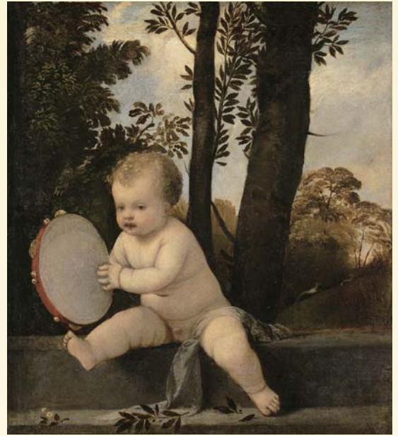
ティツィアーノ・ヴェチエッリオ 《タンバリンを演奏する子ども》1510-15年頃 ウィーン美術史美術館蔵

入館料 一般1,000円(800円)、シニア*700円(500円) 大高生500円(400円)、中学生以下無料 ※( )内は15名以上の団体料金 *シニア=65歳以上 ・前売り券はチケットぴあ、サークルK・サンクス、セブン-イレブン(Pコード 767-239)、ローソンチケット(Lコード 85092) 取扱各店にて、600円で販売