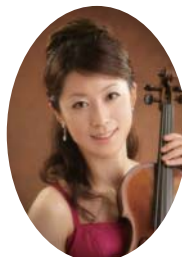
荒牧 清香 (ヴァイオリン)