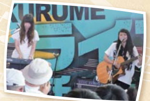
昨年のくるめライブチャレンジの様子

日程 10月29日(土)、30日(日) 会場・時間(予定) ●両替町公園/10:00~17:00 ●その他会場/10:00~16:00