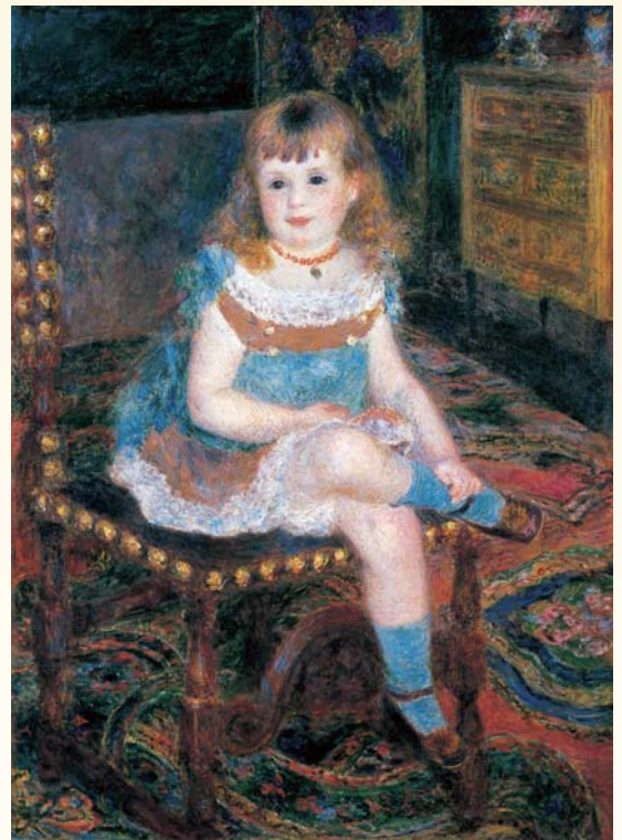
ピエール=オーギュスト・ルノワール 《すわるジョルジェット・シャルバンティエ嬢》1876年 石橋財団ブリチストン美術館蔵

入館料 一般800円(600円)、シニア*600円(500円) 大高生500円(400円)、中学生以下無料 ※( )内は15名以上の団体料金 *シニア=65歳以上 ・前売り券はチケットぴあ、サークルK・サンクス、セブン-イレブン(Pコード767-240)、ローソンチケット(Lコード85093) 取扱各店にて、500円で販売