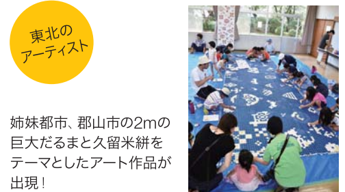
東北のアーティスト