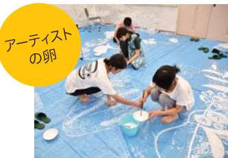
アーティストの卵

アーティストを目指す若者たちが、石橋文化センターにインスピレーションを受けて制作したアート作品を展示。坂本繁二郎旧アトリエ周辺の魅力を、昼と夜とで違った表情を見せる演出をお楽しみください。