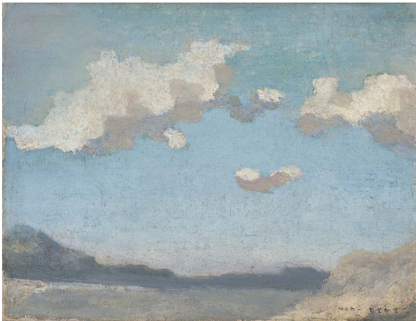
坂本繁二郎《放水路の雲》1924年 久留米市美術館蔵

※( )内は15名以上の団体料金、シニアは65歳以上 ※上記料金にて、石橋正二郎記念館もごらんいただけます。 ※前売券は、チケットぴあ、ローソンチケット取り扱い店などにて600円で販売(Pコード767-907、Lコード85057)