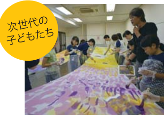
次世代の子どもたち

石橋文化センターが、アート空間に生まれ変わる!子どもたちや、大学生、地元や東北のアーティストなどのアート作品が登場。