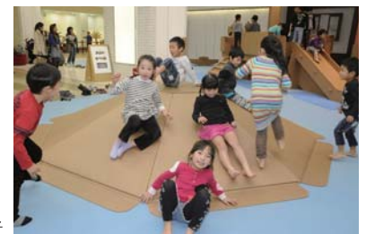
過去の展覧会の様子

入館料 3歳以上500円、2歳以下は無料(小学生以下は保護者同伴) ※本館1・2階両展をご覧になる場合は割引があります。