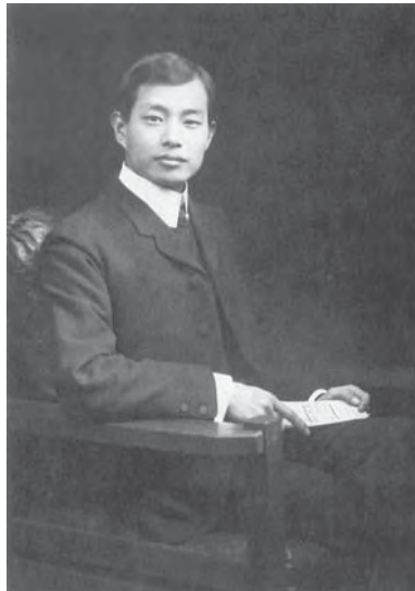
アメリカで撮影された、28歳頃の吉田博