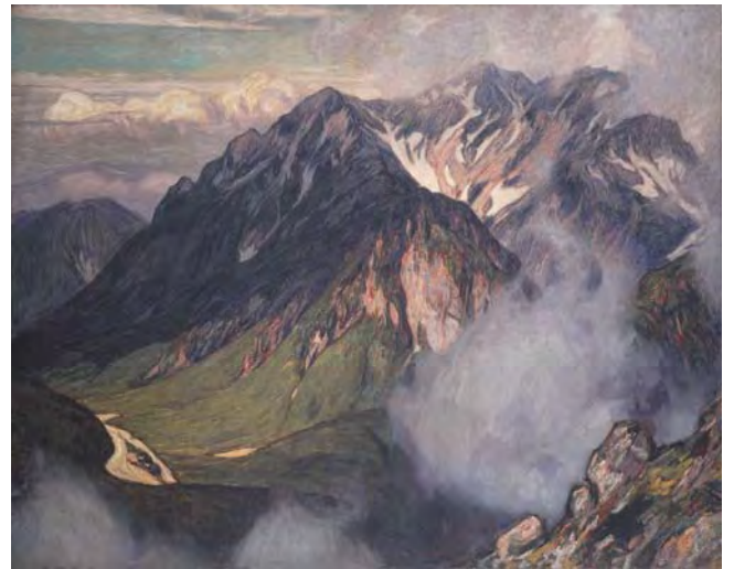
《穂高山》大正期 油彩 個人蔵