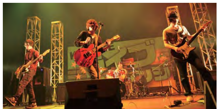
くるめライブチャレンジ2016の様子