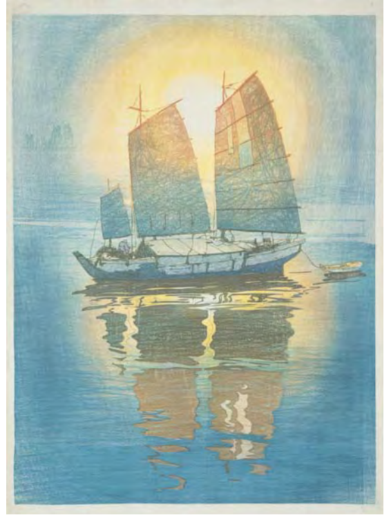
《帆船 朝日》大正10(1921)年 個人蔵

※( )内は15名以上の団体料金、シニアは65歳以上 ※上記料金にて、石橋正二郎記念館もごらんいただけます。 ※前売券は、チケットぴあ、サークルK・サンクス、セブン-イレブン(Pコード767-908)、 ローソンチケット(Lコード85058)取扱各店にて、600円で販売