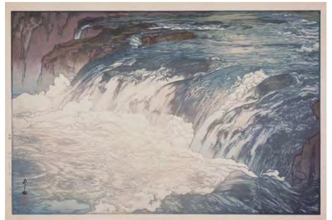
《溪流》昭和3(1928)年 木版 千葉市美術館蔵