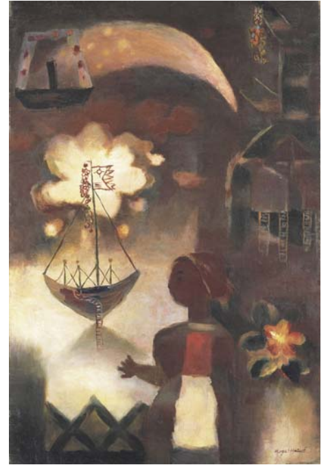
古賀春江《煙火》1927年 公益財団法人川端康成記念会

※( )内は15名以上の団体料金、シニアは65歳以上 ※上記料金にて、石橋正二郎記念館もごらんいただけます。 ※前売券は、チケットぴあ、サークルK・サンクス、セブン-イレブン(Pコード768-202)、 ローソンチケット(Lコード86081)取扱各店にて、600円で販売