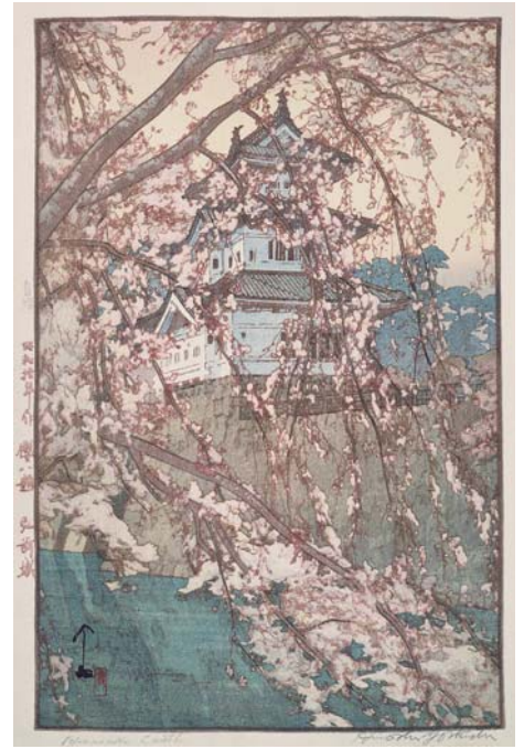
吉田博《弘前城 櫻八題》昭和10(1935)年 個人蔵

※( )内は15名以上の団体料金、シニアは65歳以上 ※上記料金にて、石橋正二郎記念館もごらんいただけます。 ※前売券は、チケットぴあ、サークルK・サンクス、セブン-イレブン(Pコード767-908)、ローソンチケット(Lコード85058)取扱各店にて、600円で販売