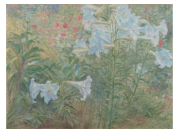
黒田清輝《鉄砲百合》1909年 石橋財団アーティゾン美術館(旧ブリヂストン美術館)蔵