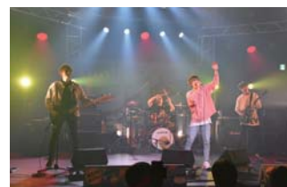
昨年のライブチャレンジの様子

開催期日 7月14日(日)、8月18日(日)、9月29日(日)、11月23日(土・祝) 会場 久留米シティプラザ(六角堂広場、Cボックス) 応募期間 9月30日(月)まで ※7/14開催分は募集締切