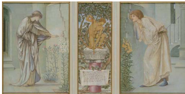
エドワード・バーン=ジョーンズ《ピュラモスとティスベ》1872-76年 ウィリアムスン美術館蔵

本展では、ラスキンに擁護された若いグループ「ラファエル前派」のロセッティやミレイらを軸に、明治の日本にも大きな影響を与えたバーン=ジョーンズの絵画や、彼らが共同作業を行ったステンドグラス・家具など、バラエティに富んだ約150点の美術・工芸を展示します。人と自然が織りなすドラマをお楽しみください。