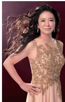
中丸 三千繪(ソプラノ)