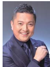
朝岡聡(ナビゲーター)

演奏予定曲 ピアノ・ソナタ 第8番「悲愴」 第14番「月光」/L.v.ベートーヴェン 歌劇「リナルド」より「私を泣かせてください」/F.ヘンデル 歌劇「セルセ」より「オンブラ・マイ・フ」/F.ヘンデル 歌劇「ジャンニ・スキッキ」より「私のお父さん」/G.プッチーニ ニュー・シネマ・パラダイス/E.モリコーネ ほか