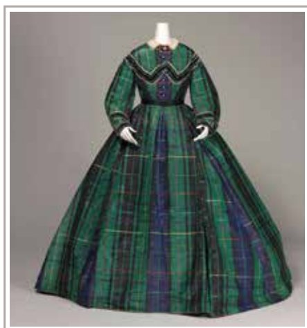
《アフタヌーン・ドレス》1865年頃神戸ファッション美術館

会場/久留米市美術館 本館1階 開館時間/10:00-17:00(入館は16:30まで) 休館日/月曜日(8/12は開館) ★8/18(日)は、18:30まで延長開館(入館は18:00まで) ■入館料 一般800円(600円)/シニア600円(400円)/大学生500円(300円) 高校生以下無料 ※( )内は15名以上の団体料金、シニアは65歳以上