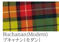
Buchanan(Modern) ブキャナン(モダン)