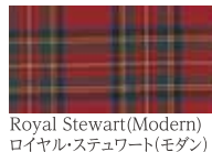
Royal Stewart(Modern) ロイヤル・ステewart(モダン)