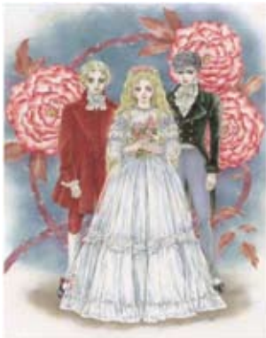
バラの rond 2019年(本展のための描き下ろし) © 萩尾望都/小学館