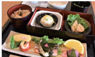
春の花御膳 (3/12~4/10) ※写真はイメージです