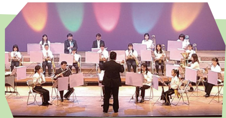
くるめJr.ブラスバンド

小学生だけでなく、中学・高校生も参加できる地域の子どもたち を対象とした吹奏楽団です。約50年の歴史を重ねてきた「久留米 児童吹奏楽団」が母体となっています。今回は、現在行っている 吹奏楽演奏を中心に、活動の成果を披露します。