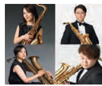
ミュージアム ガーデンコンサート 出演者 Saxophone Quartet The Cameo