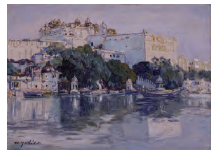
吉田博《ウダイフル宮殿》1931年 石橋財団アーティゾン美術館 ※4/14まで展示

※身体障害者手帳、精神障害者保健福祉手帳又は療育手帳等の交付を受けている方とその介護者1名は無料となります。