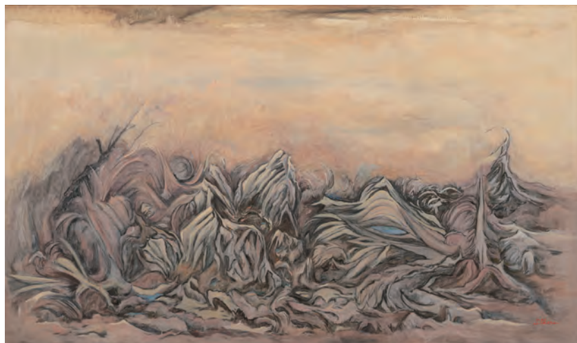
尾花成春《一筑後川より一朝羽大橋(上側)》1987年 個人蔵

青木繁や坂本繁二郎を育んだ久留米及び筑後の地にゆかりのある作家を紹介する「ちくごist」シリーズの第1回。現在のうきは市に生まれた尾花成春(おばな・しげはる 1926-2016)は、故郷である筑後の地で仕事と並行して制作を行い、前衛美術集団「九州派」での活躍や15年以上描き続けた「筑後川シリーズ」などで知られています。本展では、初期から晩年までの作品に資料も加え、ひたすら筑後で制作することにこだわった尾花成春の全貌を紹介します。