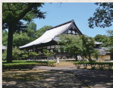
大木山善導寺(久留米市善導寺町)