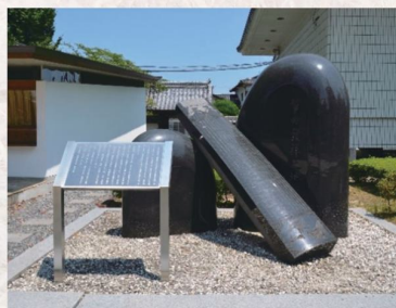
「箏曲発祥之地」記念碑(善導寺)