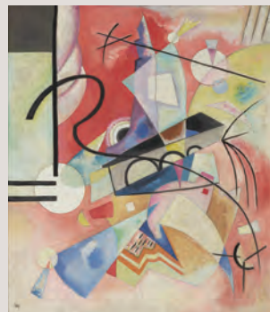
ヴァシリー・カンディンスキー《自らが輝く》 1924年 石橋財団アーティゾン美術館蔵

印象派や日本近代洋画などプリティストーン美術館の伝統を引き継ぎながらも、現代美術や女性作家の作品、日本近世美術の収集にも力を注ぎ、コレクションの幅を広げ続けるアーティゾン美術館。約3000点におよぶ石橋財団コレクションの中から、新収蔵作品を中心に、アーティゾン美術館の「いま」を伝える作品80点を紹介します。