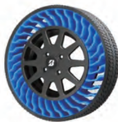
AirFree 空気充填の要らない次世代タイヤ

空気充填の要らない次世代タイヤAirFree™の実証実験を、5月7日から31日まで石橋文化センターで行います。AirFreeは、環境にやさしく安心・安全な移動を支えるもので、久留米市は、「地域社会のモビリティを支える」というブリヂストンのミッションに共感し、ブリヂストンと連携協定を締結しています。創業の地である久留米で、次世代タイヤを装着した電動車が園内を走行しますので、ぜひ乗車し乗り心地を体験してください。