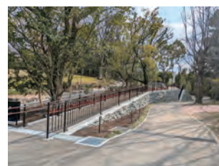
憩の森東側のスロープ整備