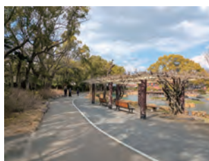
白鳥の池周辺の園路舗装

石橋文化センター園内において、昨年7月から進めていた園路舗装・スロープ整備によるバリアフリー化工事が完了しました。工事期間中はご協力いただきありがとうございました。園内の外周をつなぐルートが、ベビーカーや車椅子などでも通り易いようになりました。園内の散策や季節の花めぐりに、是非ご利用ください。