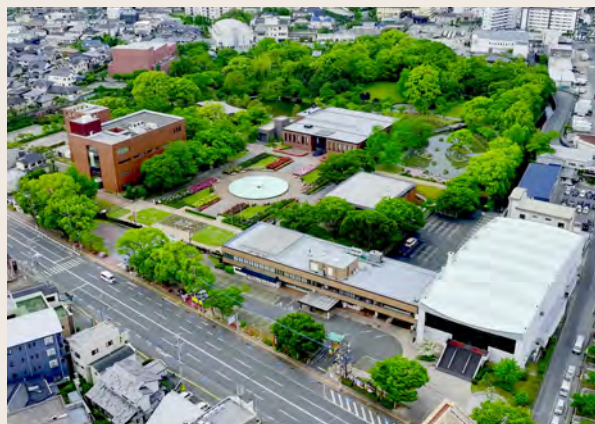
現在の石橋文化センター