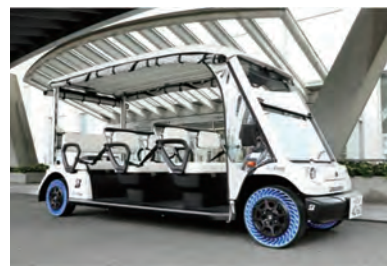
グリーンスローモビリティ 低速で公道を走ることができる電動車