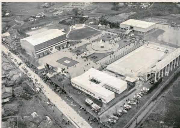
開園当日の石橋文化センター