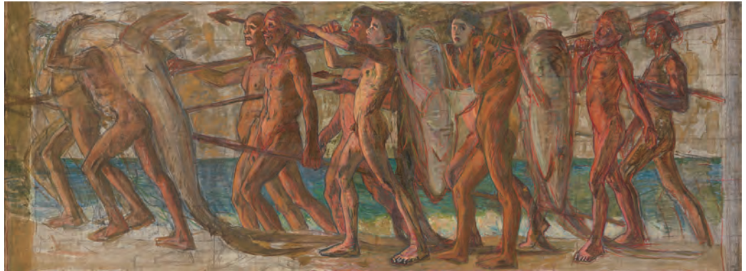
青木繁《海の幸》1904年 重要文化財 石橋財団アーティゾン美術館

久留米市美術館はまもなく開館10周年。それを祝して、東京のアーティゾン美術館(旧ブリヂストン美術館)から時代も国境も超えた名品がやって来ています。青木繁や坂本繁二郎といった懐かしの近代洋画から、セザンヌやマネらブリヂストン美術館でおなじみだった作品の数々、さらには、アーティゾン美術館となって新たに収集された尾形光琳などの日本近世美術から現代美術まで。コレクションの幅を広げ続けているアーティゾン美術館の「いま」を伝える作品80点をご紹介します。